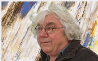
Peinture Plestin, chapelle Saint-Efflam

Une œuvre élégante et raffinée : les sculptures en bronze de Michel Le Bourhis, racontent autant sa longue amitié avec Lucien Prigent, son maître, que son amour de la vie. Dans la jolie chapelle de Sainte-Barbe, les œuvres multicolores du peintre Christian Spagnol éclairent et réchauffent la sobriété de cette exposition.