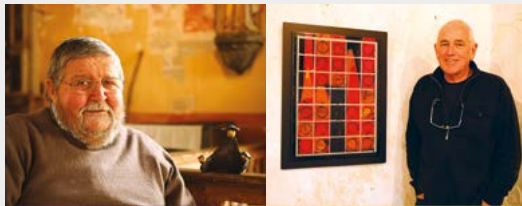
Sculpture Peinture Plestin, chapelle Sainte-Barbe

Ne pas manquer de découvrir à la chapelle Saint-Maudez, les tableaux de Françoise Schnell. Une création très originale, où la nature et ses matériaux divers, notamment des écorces aux tons subtils, viennent enrichir l'œuvre du peintre, apportant ainsi densité et éclat à la sobriété de l'acrylique.