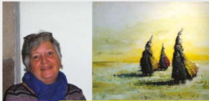
Peinture Lanvellec, chapelle Saint-Maudez